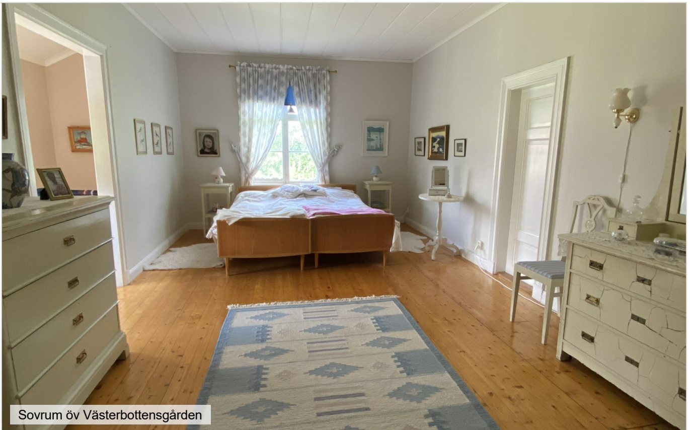
Sovrum öv Västerbottensgården