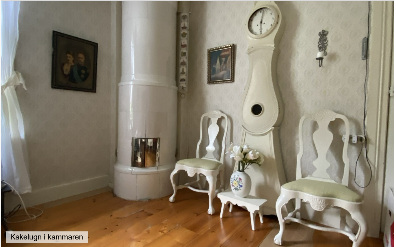
Kakelugn i kammaren